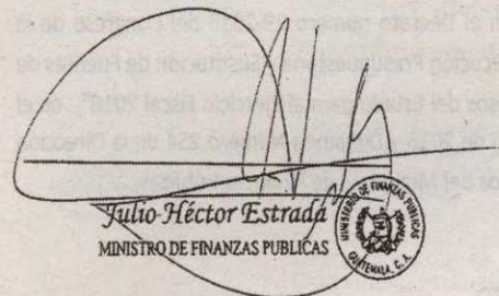
Julio Héctor Estrada MINISTRO DE FINANZAS PÚBLICAS