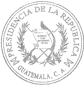
BERNARDO AREVALO DE LEÓN