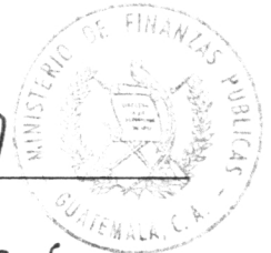
Edgar Alfredo Balsells Conde MINISTRO DE FINANZAS PUBLICAS